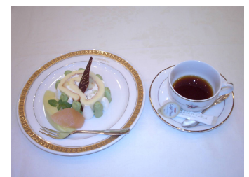
誕生祝いのケーキとコーヒー