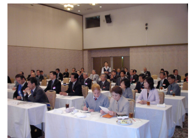
会員奥様も卓話に聞入る