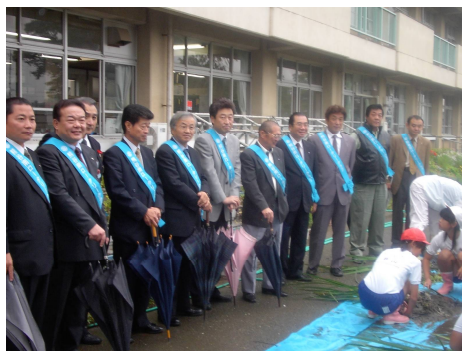
参加会員の皆さんと栗原環境保全委員長(写真右より3番目)