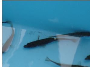
佐谷田小学校の皆さん 本日確認されたムサシトミヨ