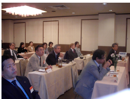
卓話に聞き入る会員の皆さん