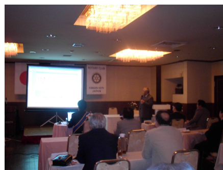
プロジェクターでの熱心な説明