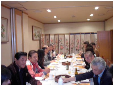
マッコリ(韓国ドブ酌)を嗜む 会員の皆さん