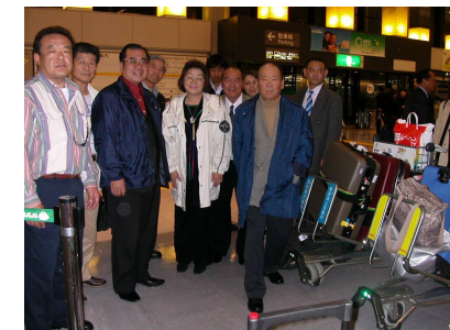
帰りの成田空港にて