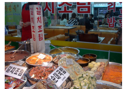
店先で売られるトッポッキ(韓国もち)