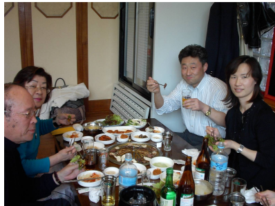
焼肉屋ムドンサンで昼食