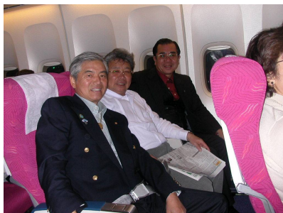
美酒に酔い気持ちよさそうな機上の人