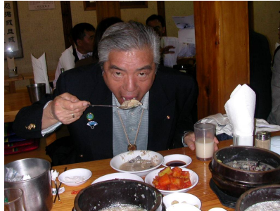
美味しそうな岡部会員