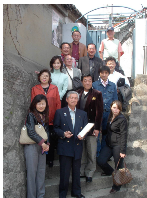
冬々のジソ(フィソ)の実家