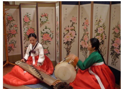
カヤグム(韓国琴)、歌 チャング(太鼓)