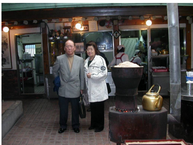
吉田副会長ご夫妻