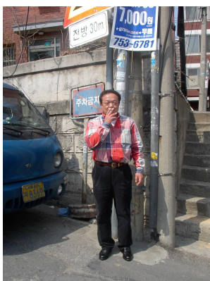
気分は° ヨソ ヲ(富山会員)