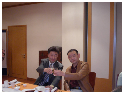
会長、幹事 お疲れさまです