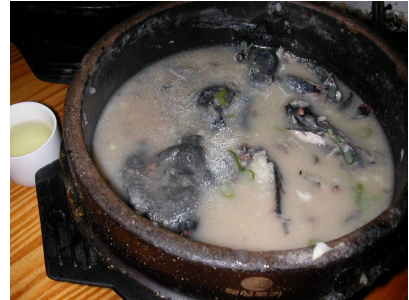
鳥骨鶏の蔘鶏湯(さんげたん)