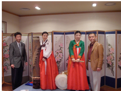
李会長より韓国民族音楽のプレゼント