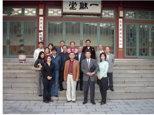
サムチャンガーにて夕食