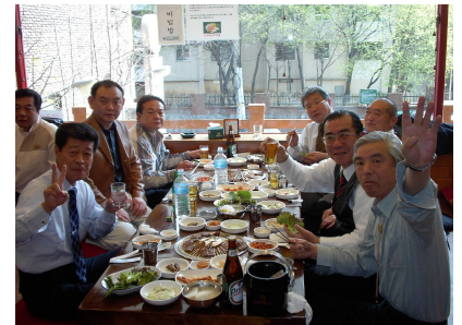
焼肉(プルコギ)を食べる皆さん