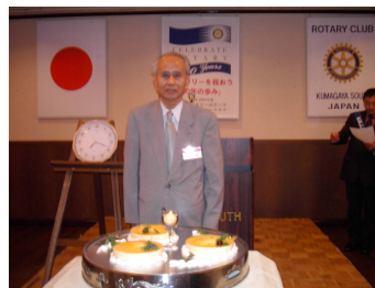
6月会員誕生祝い・清水会員