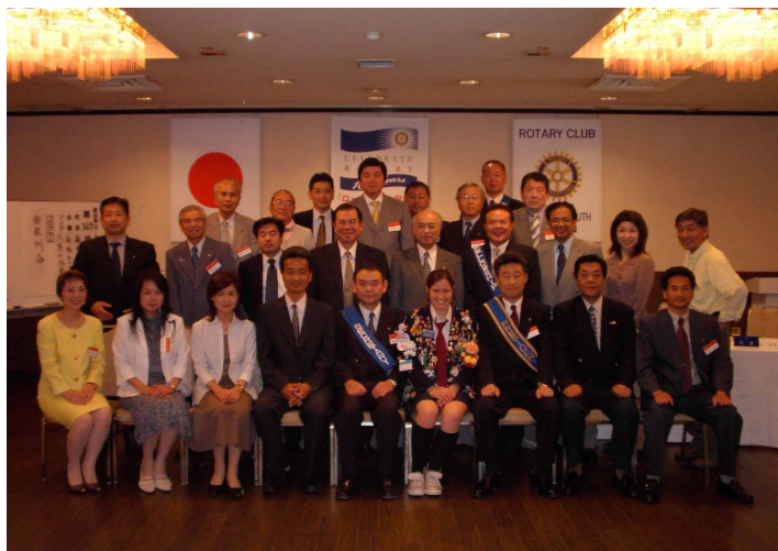
会員の皆さんと記念撮影