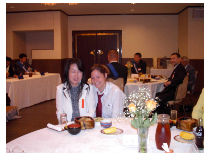
ホストファミリーの埼玉会員令夫人