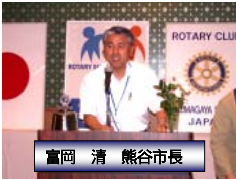
富岡 清 熊谷市長