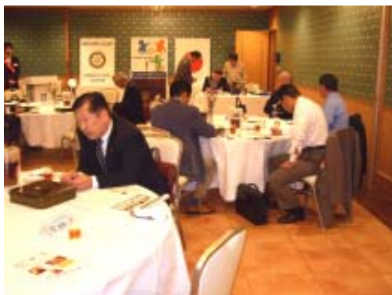
真剣にバズセッション