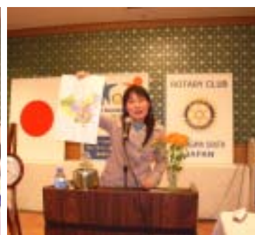
元気にスピーチする米山奨学生のお二人