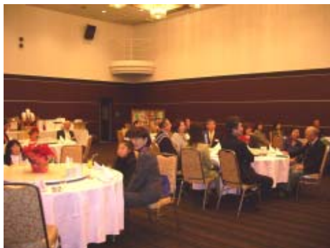
待ちに待ったクリスマス家族例会