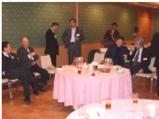
和気藹々と歓談する会員