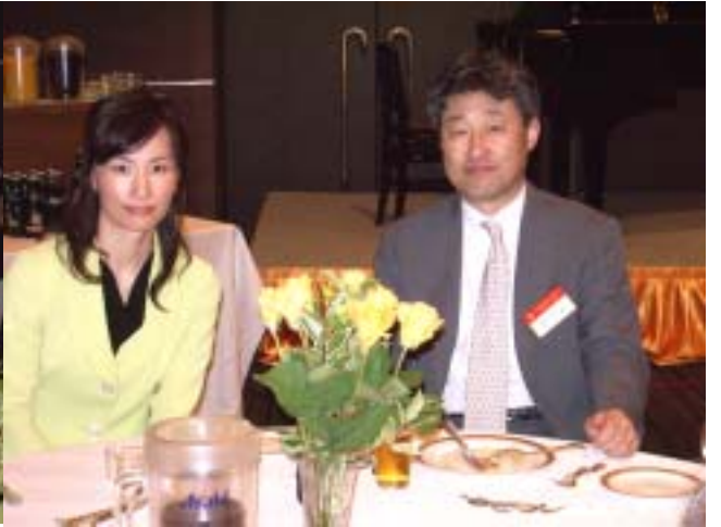
李パスト会長ご夫妻