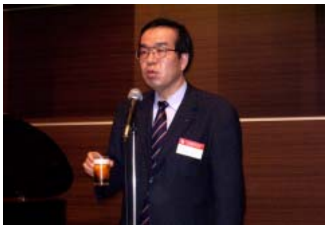
菱沢パスト会長 乾杯のご挨拶