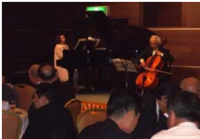
優雅なクラシック音楽の中でのフルコース