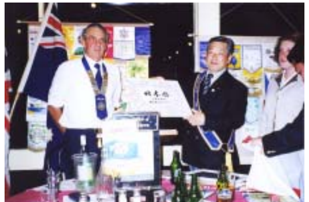
熊谷南RC会員からの寄せ書きをプレゼントする