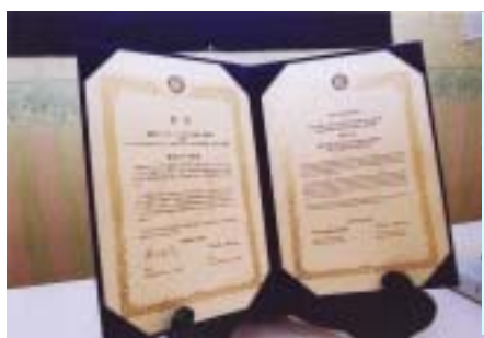
両クラブで交わされた 姉妹クラブ締結合意書