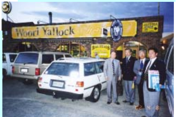
調印式が行われたレストラン (アッパーヤラRC 例会場)