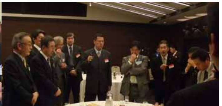
澤田次期第5グループガバナー補佐の話を聞く当日出席者