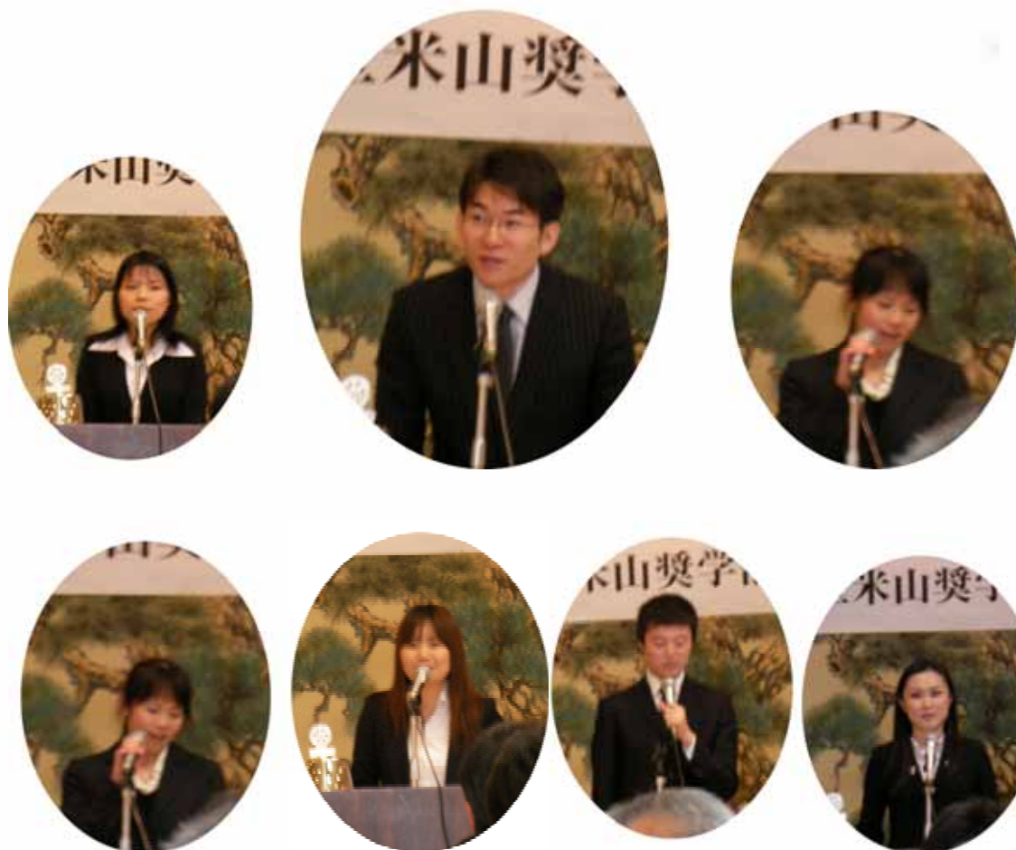
「一年を振り返って」の発表をする米山奨学生の皆さん