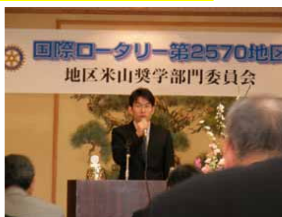
当クラブへ卓話に来て頂いた きむじゅくん 金根在くん