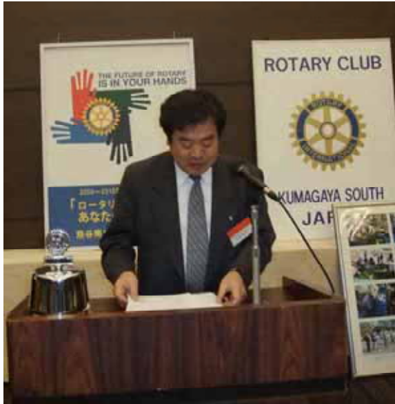
裁判員制度について熱弁する矢部会員