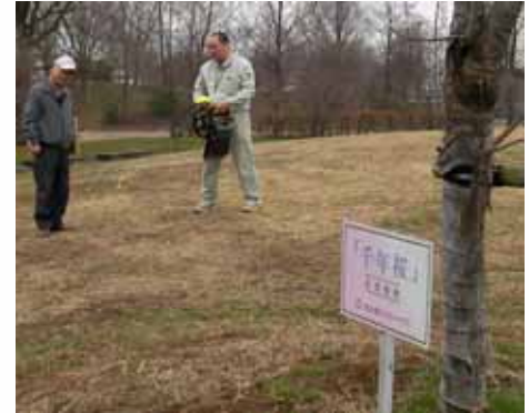
岡本社会奉仕・職業奉仕委員長と笠木主査