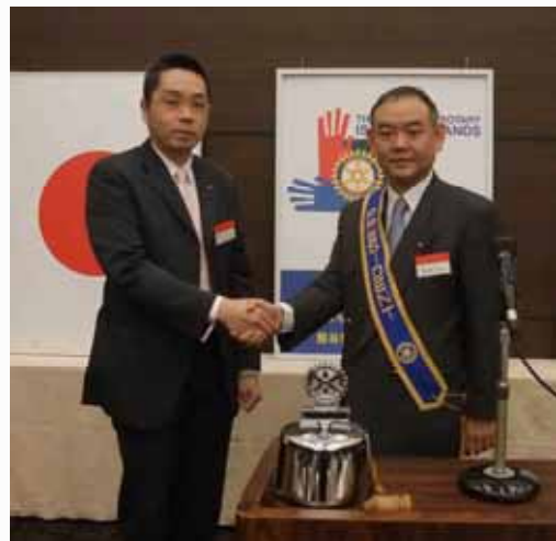
ロータリアンとしての活動に期待する会長