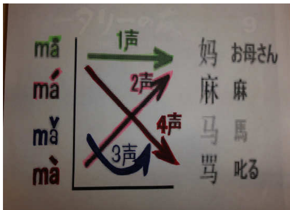
中国語には欠かせない 発音抑揚表