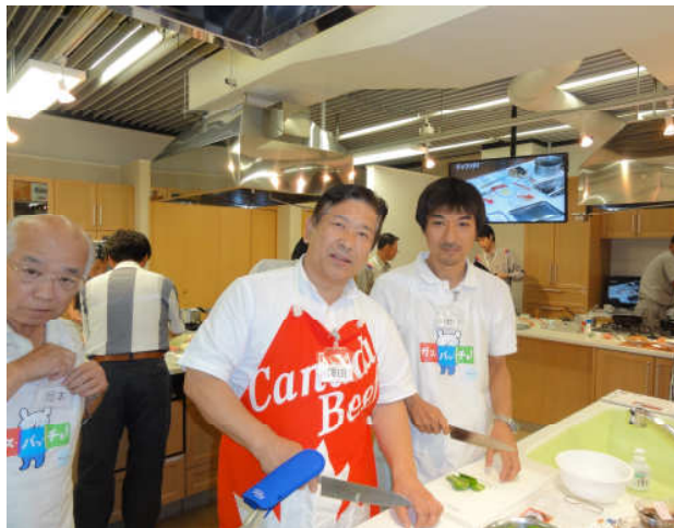
準備OK いよいよ男の料理教室始まります。