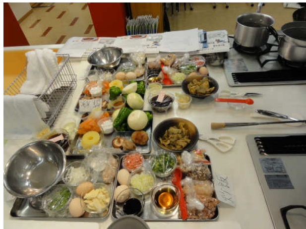
卓上にズラっと並べられた食材：今日の献立は ●酢豚・●焼豚チャーハン・●カニ入り中華風卵スープ