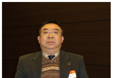
佐川ロータリー財団