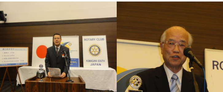
石井会報・広報・副幹事