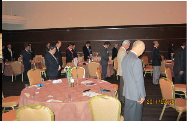
震災被害者を悼み黙禱する両クラブ会員

久しぶりの熊谷南・東 RC 合同例会。本来ならばにこやかに笑顔を交えながら懇談する場であったはず。しかしながら周知のように、今回の東北大震災・津波による家屋崩壊流出、福島原発放射能漏洩事故、と、いまだ増え続ける被害はとどまることを知りません。被災者にかかる言葉も見つからないほど悲惨な状況にただただ狼狽する毎日ですが、今日の例会は会員の中にも直接・間接的に、少なからず震災の被害に遭い、現場にかけつけた方もおられます。その経験を通じて、今後の経済傾向や保険、物流に関して詳しい会員たちにその情報の一端を語っていただき、ロータリアンとしての支援も含め、我々会員一人ひとりの処遇の方向性の参考にさせていただく例会となりました。