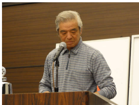
★年末、年始 行事が盛沢山です