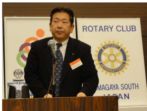
★15周年実行委員長が役割り発表