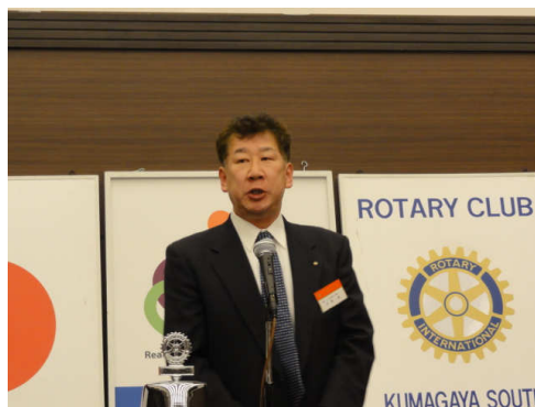
★クリスマス家族例会多数の参加宜しく