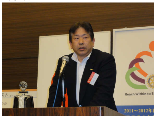
★十五周年実行委員会