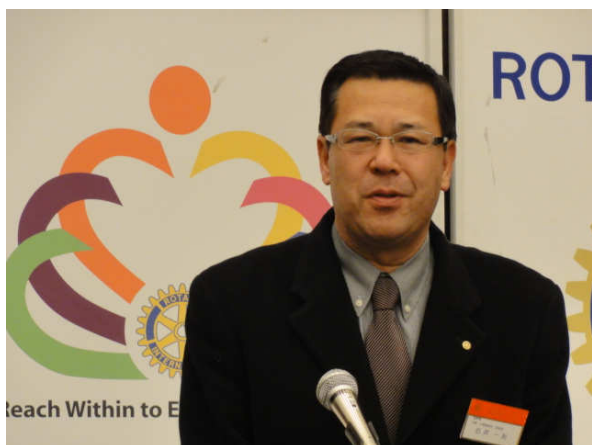
★会報・広報委員会