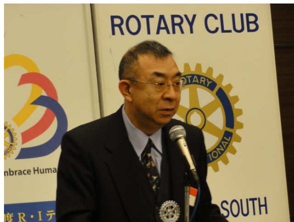
★ロータリー財団委員会