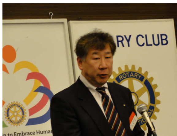
★親睦・ニコニコ委員会

つきましては今年度に於ける新米山記念奨学金功 労者の継続をして参りますのでご協力要請させて頂 いた方は宜しくお願いを申し上げます。