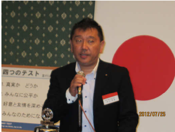
次回例会 会員による職業スピーチを紹介