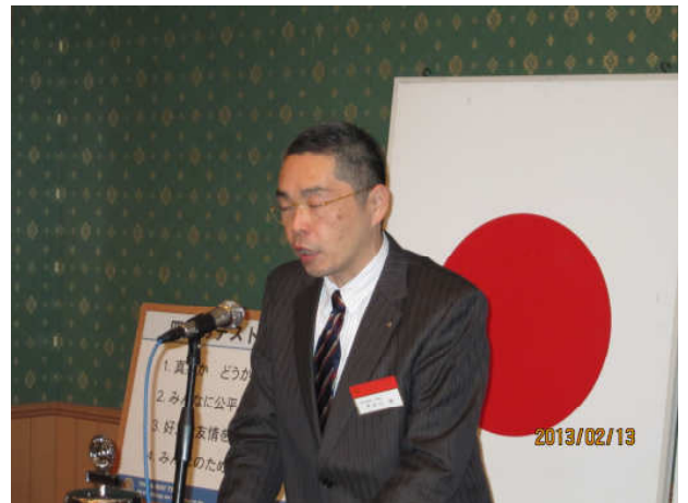
籠原RCとの合同例会紹介