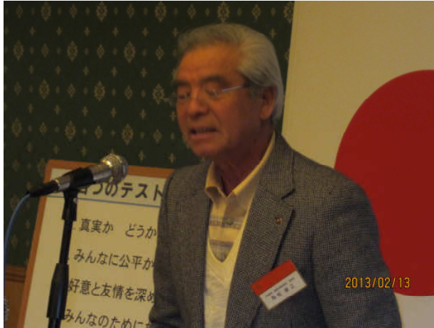
ロータリー財団セミナー報告