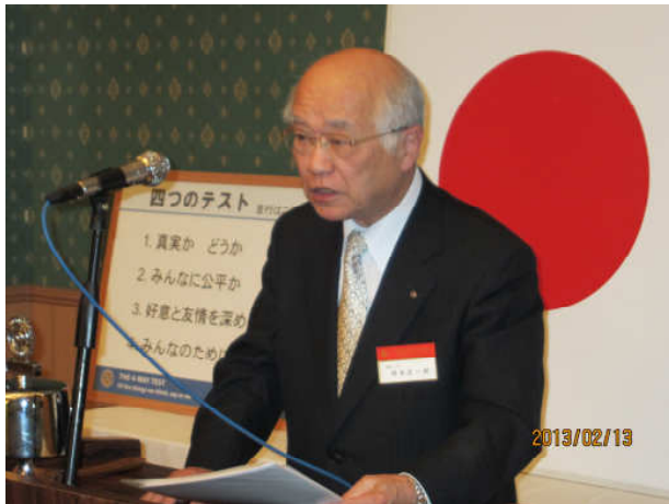
会長エレクト意見交換会報告 PETS報告