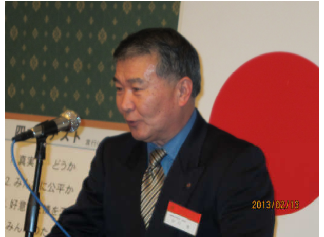
地区の様子を報告