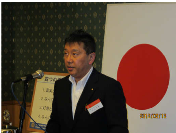
職業奉仕部門第2回セミナー報告