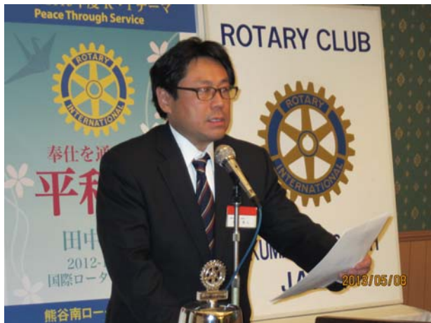
親睦旅行の日程を再確認