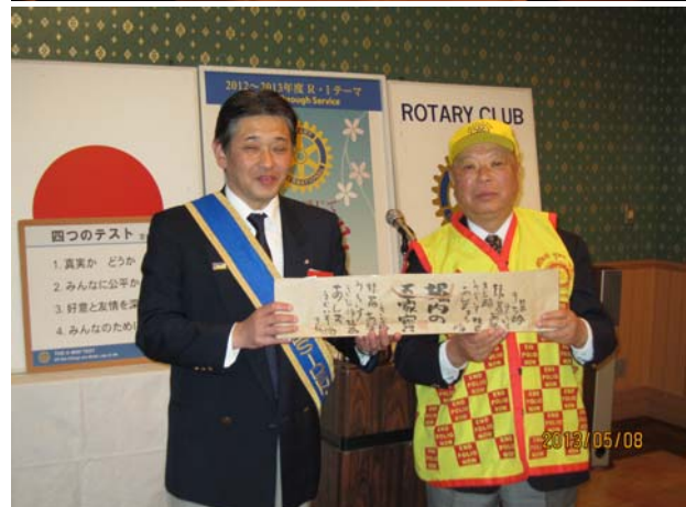
インドでのポリオ撲滅活動を報告