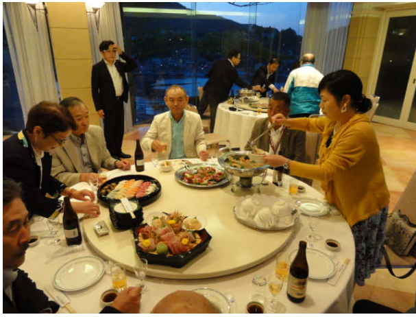
1日目 合同例会 気仙沼南RC から13名ご参加いただきました。 熊谷南RC も13名参加・・・♡