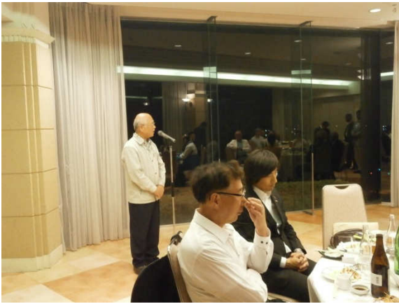
岡本友好クラブ締結委員長のご挨拶