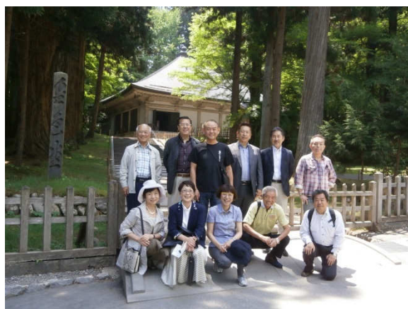
中尊寺にて記念撮影