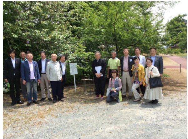
卓話終了後、八幡神社の宮司さんと、熊谷桜を囲んで.....