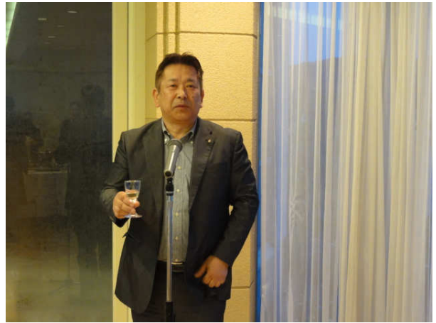
澤田副会長 乾杯のご挨拶