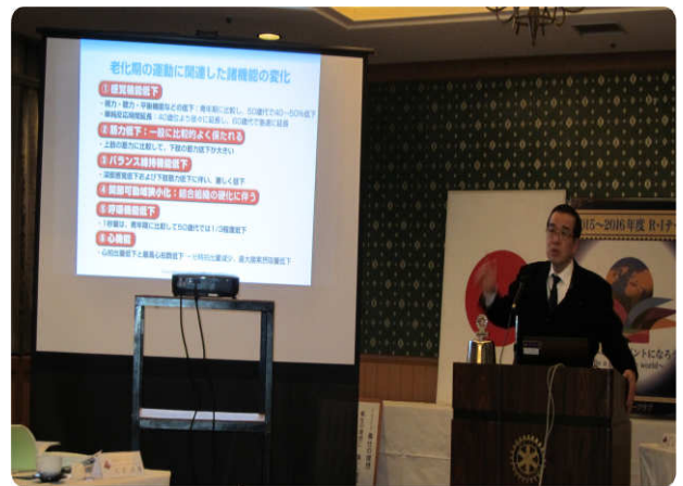
～ 卓話風景 ～

ロコモの原因疾患として、腰部脊柱管狭窄症、脊椎骨粗鬆症、変形性関節症、サルコペニアがあり、今回は腰痛と関連深い腰部脊柱管狭窄症と脊椎骨粗鬆症について予防を中心にお話いたします。