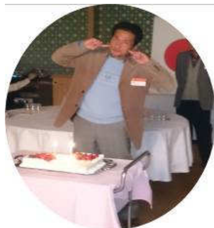
～島崎会員、おめでとうございます！～