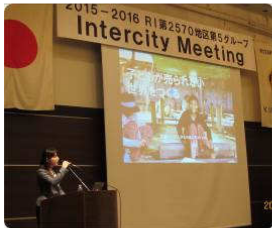
～ 第852回 移動例会 インターシティー ミーティング (IM) ～