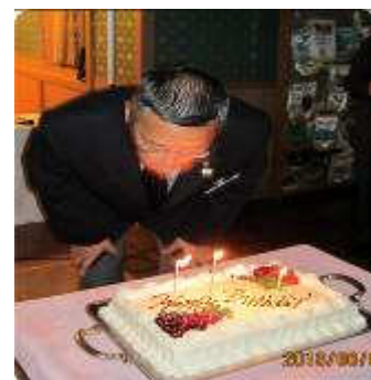
～石井会長、おめでとうございます！～