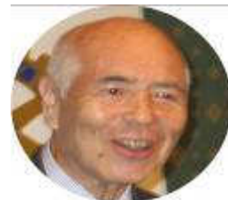
～ 清水特別代表 ～