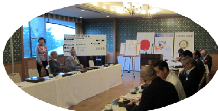
～ 例会風景 ～