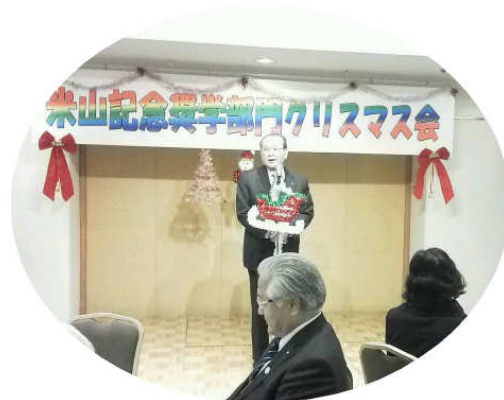
米山記念奨学会 クリスマス会