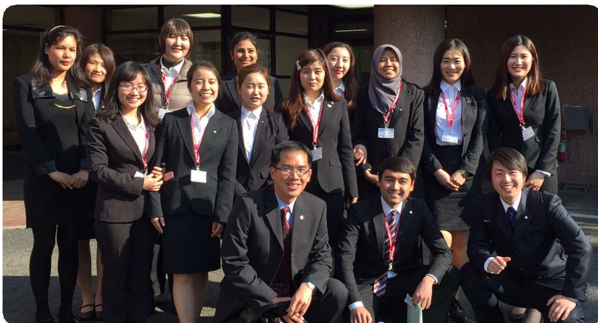
～ 今年度の米山記念奨学生の皆さん ～