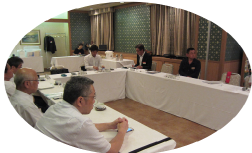
～ 例会風景 ～