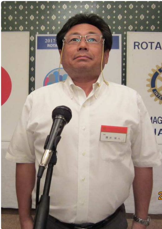
～ 少し緊張気味な清水会長 ～